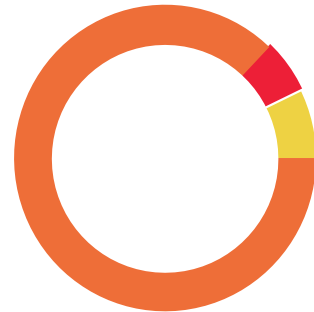
ENLACE NEGOCIOS BASICA (Saldo inicial de $22,059,059.91)